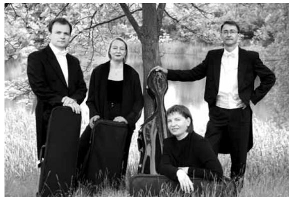
Catori Quartett Frankfurt (Oder) / Kwartet Catori