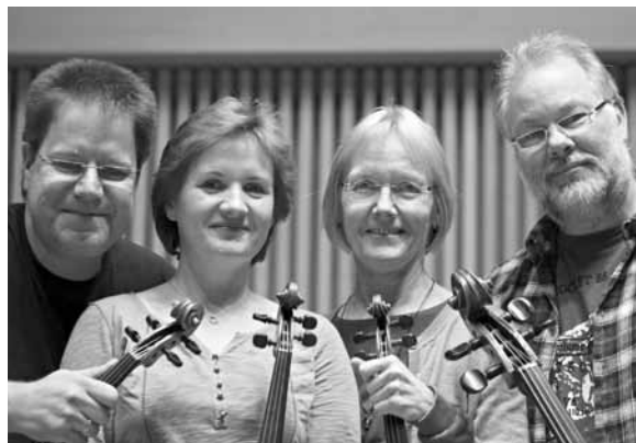
Quartett »ConMot(t)o / Kwartet »ConMot(t)o«

Sonntag / niedziela | 12.3.2017, 17:00, Frankfurt (Oder) Konzerthalle »Carl Philipp Emanuel Bach« Sala Koncertowa im. Carla Philippa Emanuela Bacha