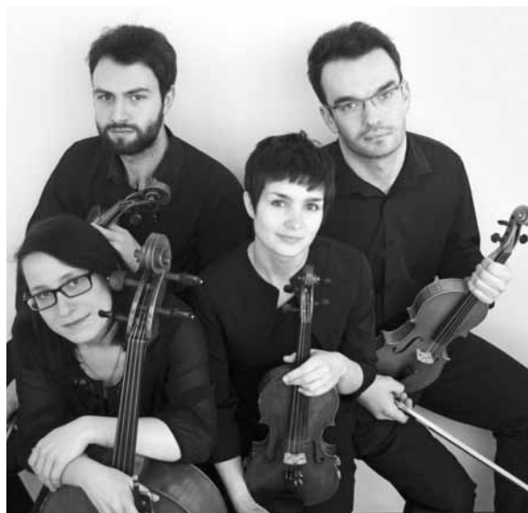
Quartett »Aquila« / Kwartet »Aquila«