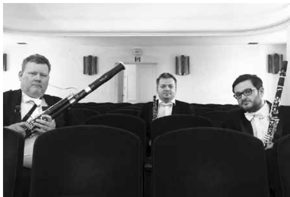
Trio Reed Connection

Freitag / piątek | 10.3.2017, 19:30, Frankfurt (Oder) Buchhandlung Ulrich von Hutten Księgarnia Ulrich von Hutten