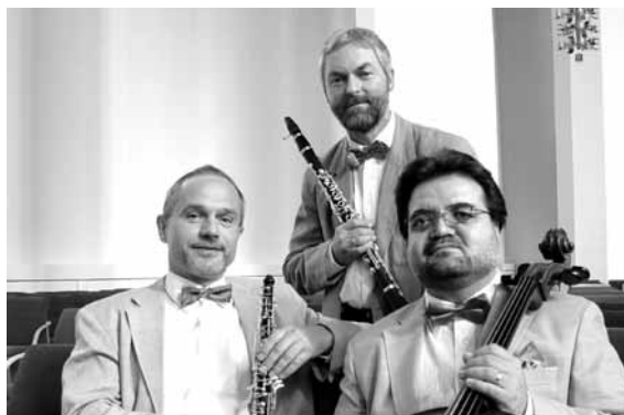
Trio »Opus 3«